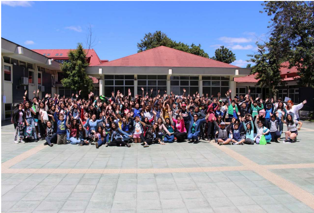
Programa de Verano, enero 2021. Ad portas de una pandemia que marcaría distanciamiento social y uso de mascarillas durante el año 2020 y 2021.